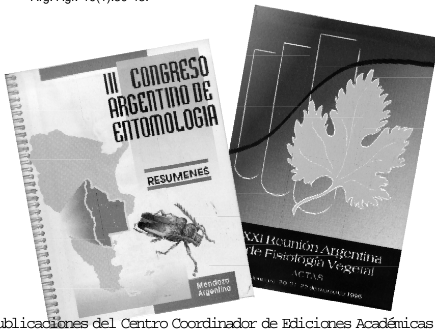
Publicaciones del Centro Coordinador de Ediciones Académicas