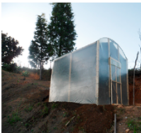
Figura 1. Sistema implementado

El hardware además de adquirir los valores máximos y mínimos alcanzados al interior de la marquesina, permite activar los moto-ventiladores para la extracción de la humedad en el interior y la circulación del aire de la cámara intermedia o de precalentamiento a la cámara de secado.