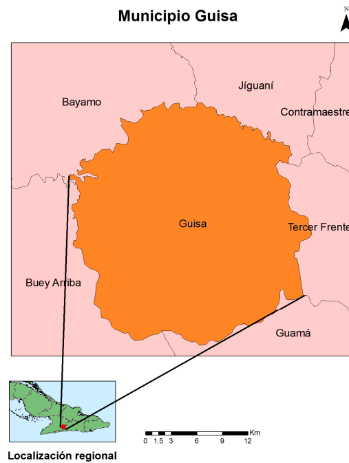
Figura N°1. Situación geográfica del área de estudio