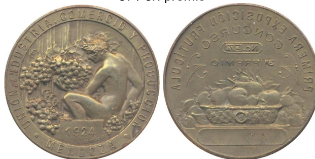
Figura 2: Medallas de premiación en la I Exposición Frutícola de Mendoza, 1924. Anverso: Unión, Industria, Comercio y Producción / Mendoza / 1924. Reverso: Primera Exposición Frutícola / concurso / no. 57 / 3r. premio