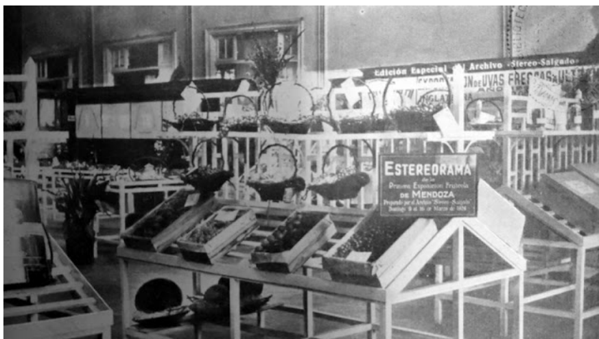
Figura 1: Primera Exposición Frutícola de Mendoza, 1924.