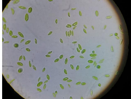
Figura 4 Microalgas en efluente Secundario. Vista por microscopio óptico en aumento de 100x.

la morfología de la cepa se observa en la mayoría de la población normal. (Figura 5)