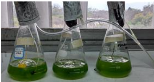
Figura 3 Cultivo de la cepa al día 15.