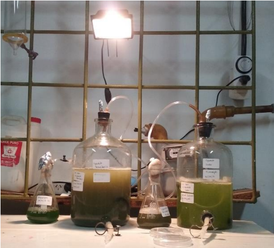
Figura 5. Biorreactores de 4 litros