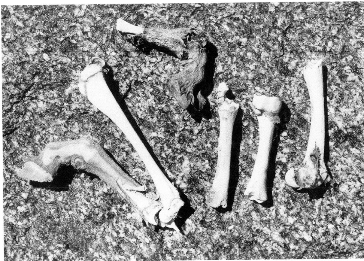
Figura 4. Patas y huesos de un venado andino, recolectados junto al "altar" de los Nevados de Chuscha.