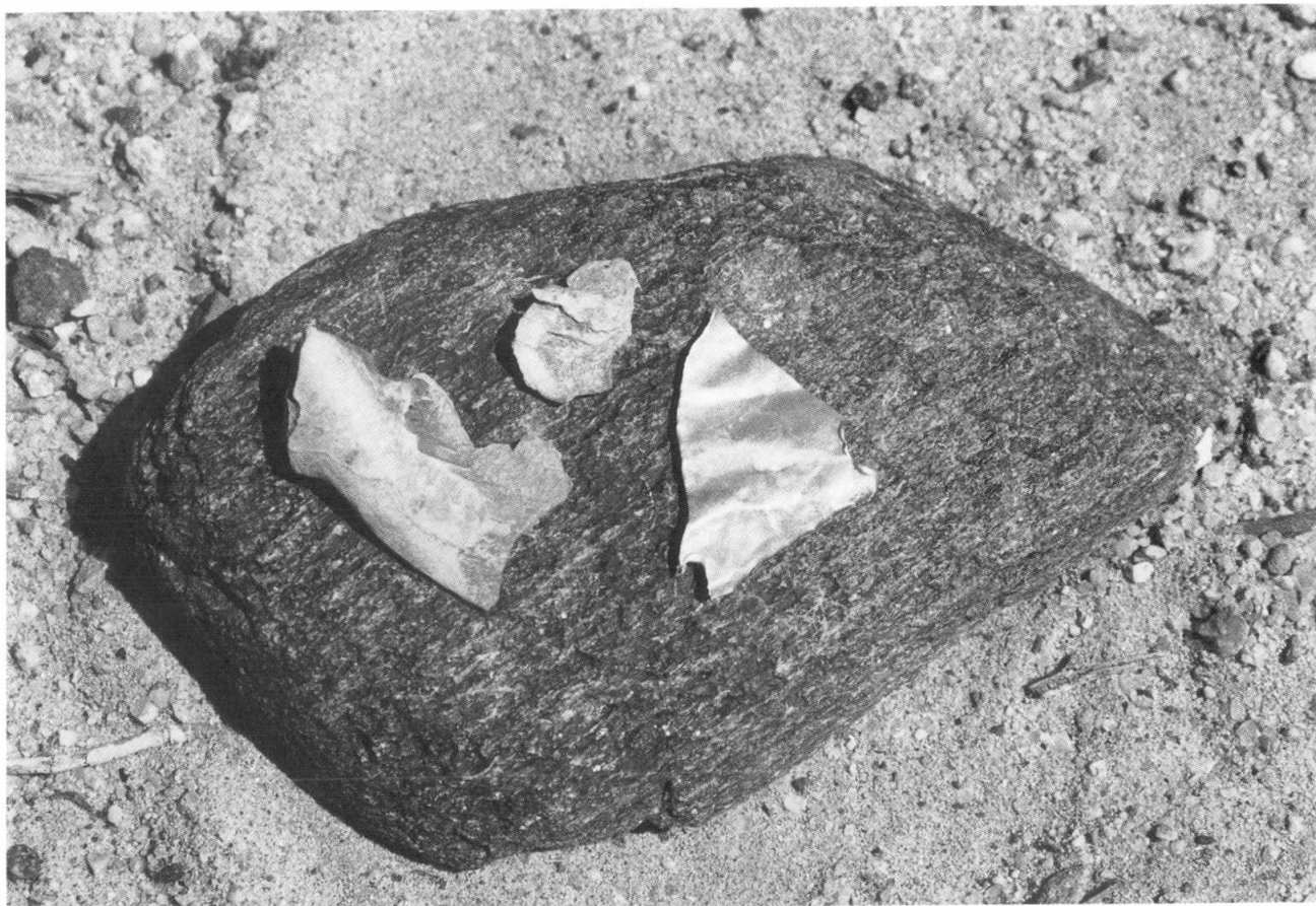
Figura 3. Nevado de Chuscha Sur: Laminilla de oro y probables trozos de valva marina (Spondylus), del "altar" descubierto en 1992.