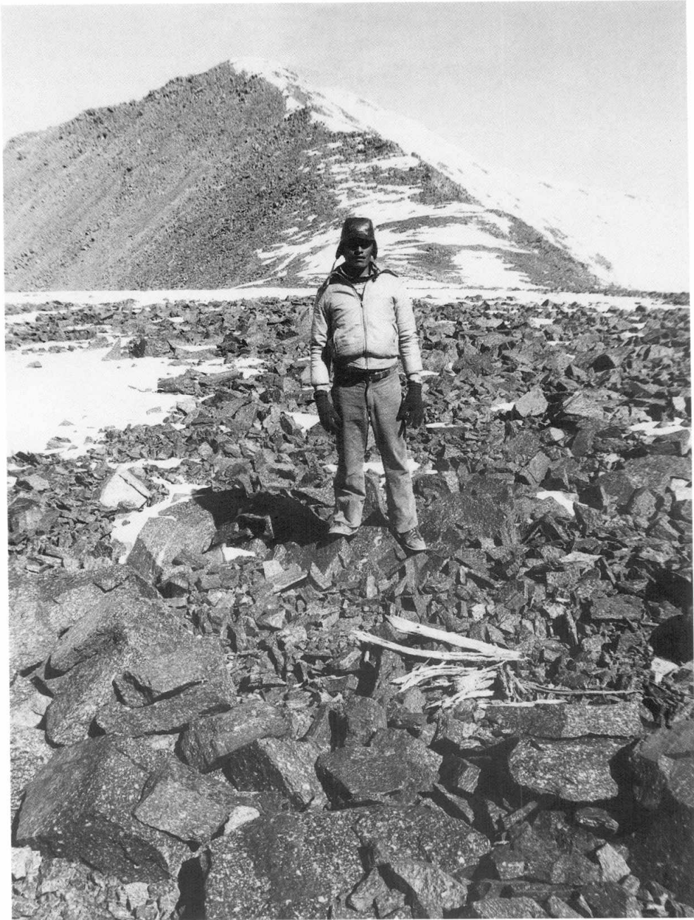
Figura 1. Al pie de la cumbre máxima del Nevado de Chuscha se hallan las pircas y la leña descubiertas por A. Beorchia en su primera expedición (1984). Correspondería al sitio B del plano, aprox. 5300 m.