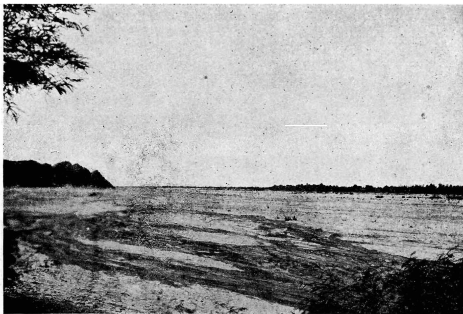
b) Río de Belén, antiguo Famayfil, en cuya margen derecha, al fondo de la fotografía, estuvo la segunda Londres.