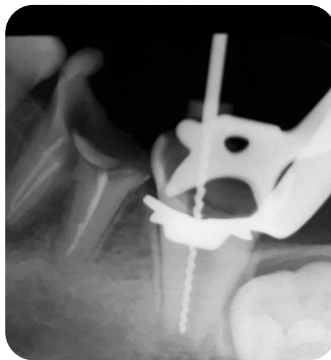
Fig.2 – Radiografía conductométría elemento 37.

(Sanctuary™ Dental dam 5x5) y Clamp (1U Hygenic® - Coltene). Una vez aislado el elemento, se seleccionó una lima k N°80 (Dentsply® – Maillefer) previamente calibrada a la longitud obtenida a partir de la radiografía previa (17mm), tomamos conductometría para verificar la longitud de trabajo, en este caso no se utilizó conductometría electrónica porque no existe un instrumento que ajuste a nivel apical, por ende la lectura iba a resultar errónea, verificamos en la radiografía la longitud de trabajo correcta ( Fig.2 ) y se procedió a la limpieza y desinfección del conducto radicular con hipoclorito al 2.5% por 30 minutos situándonos a 4mm de la longitud de trabajo, con mucho cuidado y sin ejercer presión para evitar una extravasación de hipoclorito a los tejidos periapicales, debido al calibre del conducto y presencia de ápice abierto se utilizaron concentraciones bajas del irrigante, el elemento no se instrumentó debido al calibre del conducto que no lo permitía.