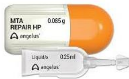
Fig.4 – MTA Repair HP