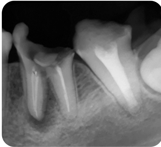
Fig.8 – Radiografía final

A la observación radiográfica se vio un sellado homogéneo del conducto sin extravasación de material, dándonos a suponer un sellado tridimensional con MTA a nivel apical.