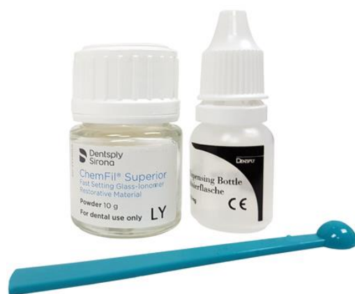
Fig.7 – Ionómero vítreo Chemfil superior (Dentsply Sirona®)