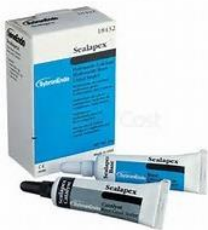
Fig.6 – Cemento sellador Sealapex®