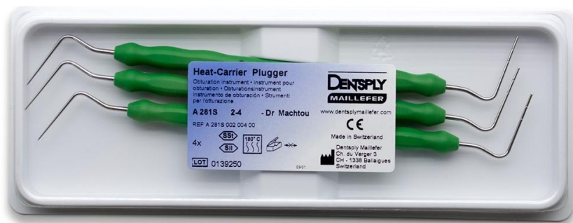
Fig.5 – Machtou – Dentsply Maillefer®.