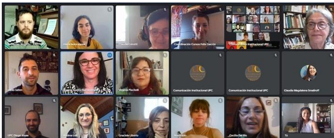
Imagen N° 5: Congreso Rondó de Experiencias 2021, Presentación de un trabajo