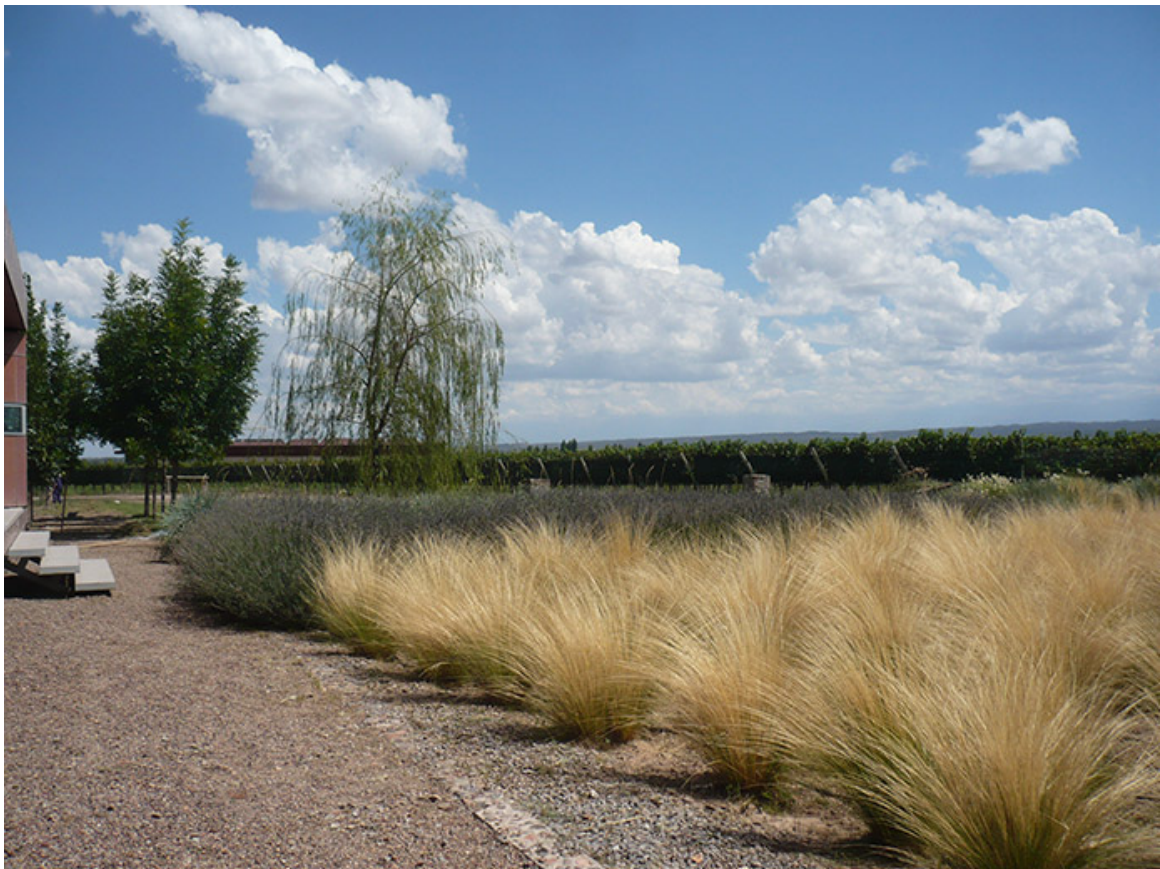
Macizo de Jarava ichu en Bodega Chakana, Agrelo, Luján de Cuyo.

Si bien Jarava ichu y Nassella tenuissima son distintas especies, su aspecto vegetativo similar y las ligeras diferencias en el comportamiento y en la fenología permiten disponerlas como macizo monoespecífico, con manejo de poda diferencial y renovación de plantas envejecidas.