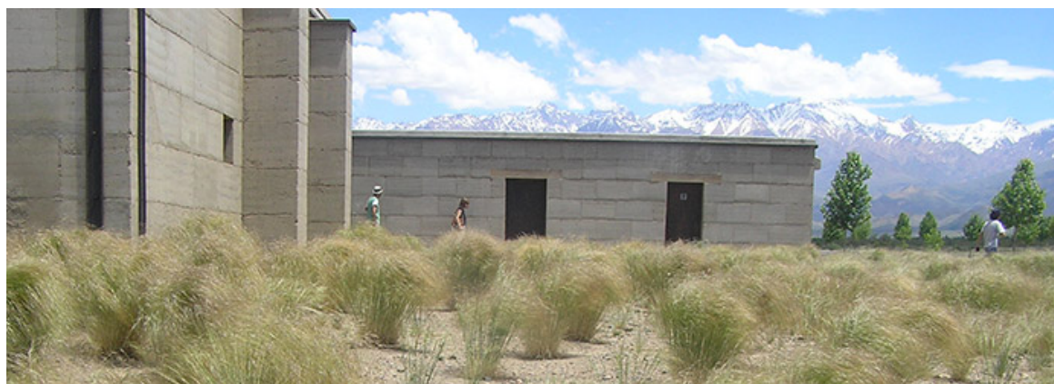
Nassella tenuis en Bodegas Salentein, Tupungato.

Las gramíneas han logrado una amplia difusión como plantas ornamentales en el paisajismo contemporáneo. Sin embargo, el conocimiento con respecto a sus requerimientos de cultivo y su producción en vivero todavía es limitado.