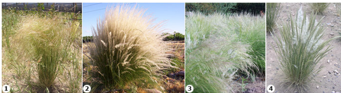
Los "coirones" estudiados: 1. Nassella tenuis , 2. Jarava ichu , 3. Nassella tenuissima , 4. Pappostipa vaginata

El estudio del valor ornamental de las cuatro especies se realiza en la parcela de la Cátedra de Espacios Verdes (localidad de Chacras de Coria, Mendoza) con plantas en suelo franco-arcilloso, a pleno sol y riego por goteo, con un aporte de 20 litros de agua/planta/semana en verano y 10 litros en invierno. Si bien son plantas resistentes a sequía (xerófitas), el riego moderado mejora su expresión vegetativa.