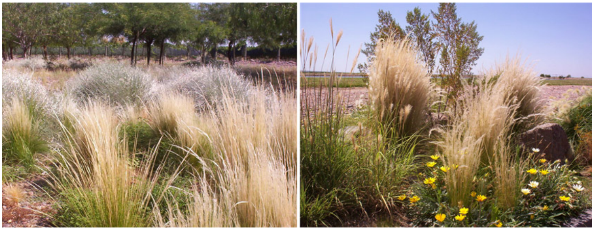
Jarava ichu con olivillo (izq.) en Barrancas y junto a Gazania, jarilla y Trichloris (der.) en Agrelo.

El estudio de las combinaciones posibles no se acota a este reducido número de especies mencionadas. Solo intenta ser un avance para que, a partir de la observación de la naturaleza y de la puesta en juego de la sensibilidad y creatividad individual, cada uno pueda seguir indagando en esta búsqueda.