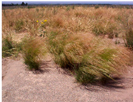
Nassella tenuis en hábitat natural, Gualtallary. Tupungato.

En su hábitat natural crecen en suelos arenosos. Requieren de pleno sol, aunque algunas especies se adaptan a media sombra. Presentan alta resiembra, hecho ventajoso según el interés paisajístico, aunque puede resultar negativo por su invasividad. En este sentido, Rúgolo de Agrasar y Puglia (2004) mencionan que algunas especies del género Nassella se han naturalizado en regiones tropicales de Asia y Australia y son consideradas maleza de difícil erradicación.