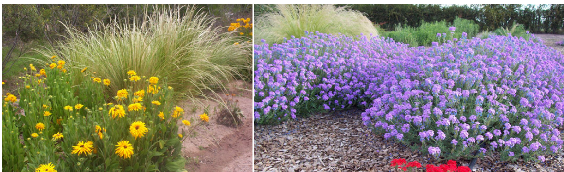
Rudbeckia junto a Jarava ichu (izq.) y Nassella tenuissima junto a Glandulariatenera (der.) en Chacras de Coria.

Pueden compartir escenario con otras herbáceas perennes de flores color lila, violeta o morado, como glandularias, Verbena bonariensis , lavandas o perovskias que en primavera armonizan con el verde tierno del follaje y las inflorescencias blancas de los coirones y hacia el otoño con el color pajizo. Combina con amarillos dorados y anaranjados, de Rudbeckia y Gazania o de nuestras melosillas y mirasolillos de floración estival, que resaltan frente al castaño de la "stipas" en verano.