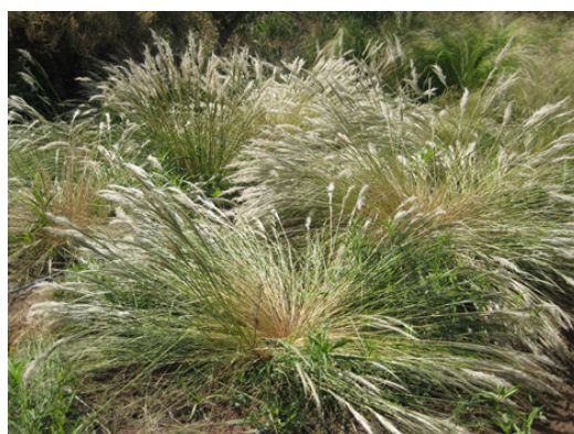
Aspecto de Pappostipa vaginata luego de granizo

Un carácter importante, a tener en cuenta, es la longevidad del cultivo. Se manifiesta cuando solo el perímetro de la corona presenta activo crecimiento y las yemas del centro mueren; en ese momento se aconseja reemplazar el ejemplar por plantas provenientes de semilla. Nassella tenuis y Pappostipa vaginata duran en cultivo 3-4 años, Jarava ichu 5-6 años y N. tenuissima , la más longeva, permanece en cultivo incluso después de 8 años.