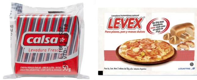
Imagen 5. Marcas comerciales de levadura que se pueden encontrar en el comercio argentino para la elaboración de panificados.

A partir de la receta que les proporcionamos, les proponemos la elaboración de dos masas de pan: