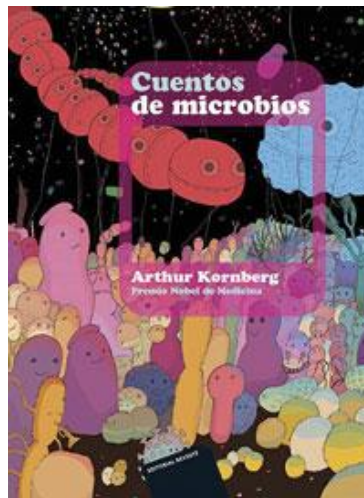
Imagen 3. Portada del libro “Cuentos de microbios” de Arthur Kornberg, publicado en el año 2018.

Para ello, los instamos a leer un libro llamado “Cuentos de Microbios” de Arthur Kornberg (bioquímico estadounidense que fue galardonado con el premio Nobel de Medicina en el año 1959), el cual es una serie de poemas dedicados a distintas bacterias con imágenes e ilustraciones.