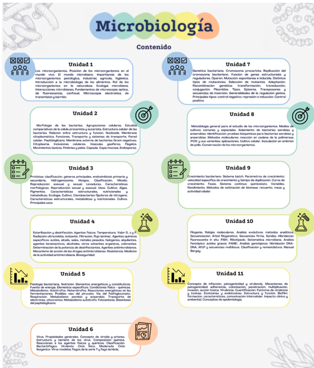
Imagen 1. Contenido de la materia de Microbiología - Primera seis unidades

El contenido de la materia se divide en 11 unidades y consisten en: