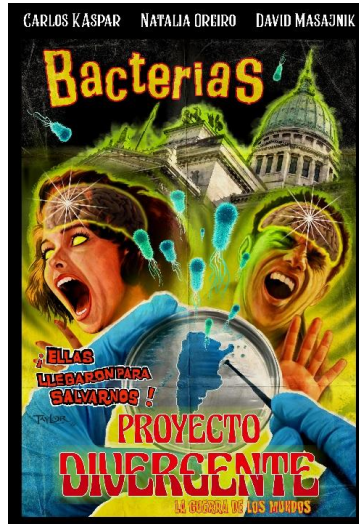
Imagen 4. “Proyecto divergente: la película protagonizada por bacterias”, realizado por estudiantes de la UADE en el año 2022.