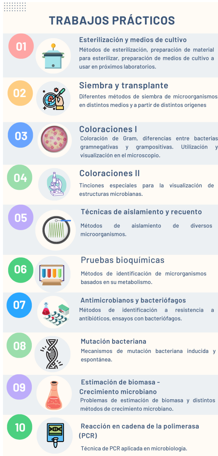
Imagen 2. Trabajos prácticos que se llevan a cabo en la materia de Microbiología

En cuanto a los trabajos prácticos, los mismos son en total 10, de los cuales 8 se desarrollan como prácticas de laboratorio, mientras que los 2 restantes son prácticos de aula con el desarrollo de problemas.