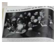
Fig. 4 Pedido de Renuncia a Vicepresidente

Luego de esta nota, que marca una postura clara, a través de las páginas aparecen fotos que grafican lo que se expuso en la nota anterior y se observa la entrada de las tropas en la ciudad resaltando que nunca habían sido tan agasajados por la multitud, haciendo énfasis en las flores que las mujeres tiraban a los “mártires” y a Uriburu. También se destaca la multitud sobre la Plaza de Mayo cuando prestaba juramento del salvador de la patria. (Fig. 2). Se presenta como gesta patriótica y condena a Yrigoyen.