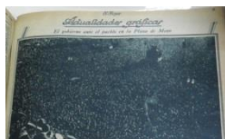
Fig.2 Plaza de Mayo en jura de Uriburu

El 6 de septiembre de 1930 abre para la República Argentina una nueva era de progreso y de cordialidad que habrá de reflejarse ampliamente sobre este país de trabajadores infatigables que sienten el orgullo de su nacionalidad y aman a la patria con la sagrada unción que aprendieron de los próceres de Mayo. ( El Hogar , 12/9/1930).