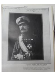
Fig.14 Fotografía obsequiada por Uriburu

Consecuencia de este suplemento Uriburu concede una entrevista a El Hogar el 31 de Octubre a Luis Pozzo Ardizzi donde cuenta cómo inició la idea en abril y mayo de 1929 entre amigos y los detalles de ser perseguidos, la organización, estrategias y desarrollo de los momentos previos. Luego felicita por el esfuerzo gráfico a la revista ya que “pone de manifiesto una vez más cómo el periodismo honesto puede contribuir en la preparación de este