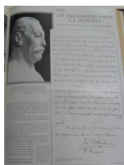
Fig. 14 Documento historico de Uriburu al director de El Hogar .

El 26 de Diciembre vuelve a otorgar otra entrevista a Julio Mc Donall para declarar los propósitos a la opinión pública sobre asuntos económicos, universidades y temas que preocupaban a la sociedad. Al año se realiza una conmemoración con desfile de brigadas de la Legión Cívica y se muestran fotos gigantes de multitudes como manifestación del culto a un líder del movimiento. Para fines de 1931 se realizan las elecciones, el 19 de febrero de 1932 le hacen otra entrevista como figura nacional y el periodista Pedro Alcazar Civit nota un Uriburu distinto, sin la mirada altiva ni la risa segura, que inició con una revolución su carrera pero que ahora es enemigo de la revolución. Ante la transmisión de mando dice que la