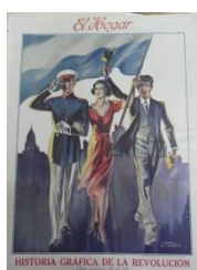
Fig.8 Tapa de El Hogar 3/10/1930

El 3 de Octubre , cuarto número en seguir tratando la temática, poco visto en revistas