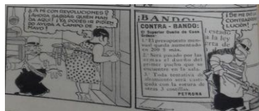
Fig.7 Las Aventuras de don Pancho Talero 19/9/1930