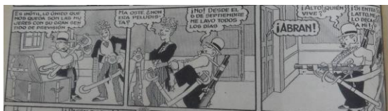
Fig.6 Las Aventuras de don Pancho Talero 12/9/1930