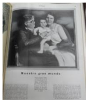
Fig. 5 Esposa, hija y nieta de Uriburu

renuncia del Doctor Enrique Martínez y en la explicación de la foto se dice “Se puede advertir la expresión enérgica del teniente general Uriburu” (Fig.4). Se quería mostrar una postura decidida, firme y segura. Aparecen momentos de la Revolución y otro título como “Los Valientes cadetes de la Escuela Militar” con las fotos de los soldados cadetes. Siendo una gesta heroica hubo poco despliegue militar 6 .