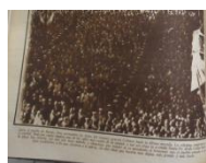
Fig. 15 Multitud acompañando restos de Uriburu

amargura que tiene es haber perdido cientos de amigos e incluso desterrado por las circunstancias porque podían perjudicar la revolución. La misma, el 26 de febrero , es informada con fotografías y el 6 de mayo se publica una de él con su familia pero se escribe “el ilustre hombre público desaparecido”. El 20 de mayo se publica el funeral en memoria de Uriburu en París, el 27 de mayo