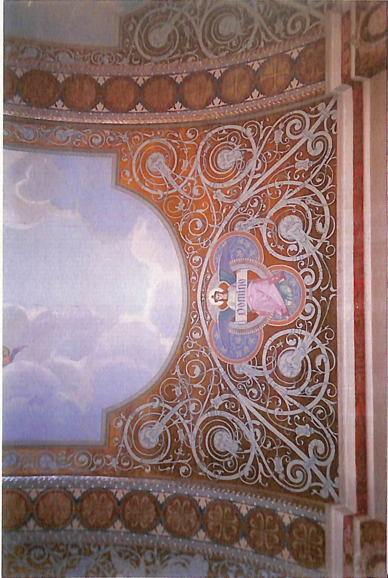
Ramón Subirats, decoración techo, detalle