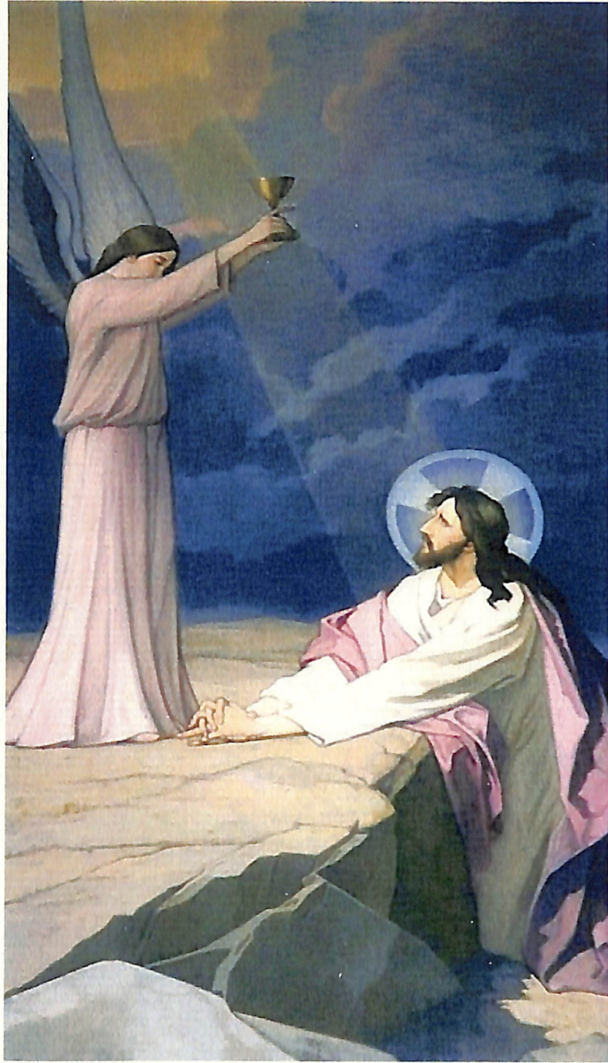
Ramón Subirats, Oración en el Huerto