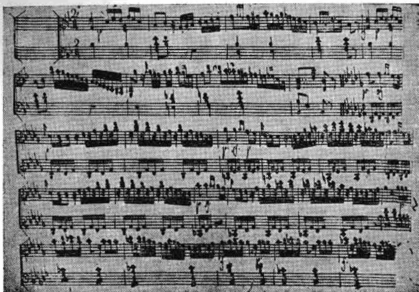
Primera página de la Sonata para Clave o Piano de Giulio Sarmiento. (Biblioteca Nacional de Rio de Janeiro).